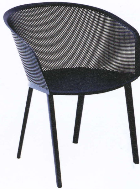
La chaise "Stampa", design Ronan et Erwan Bouroullec. Kettal