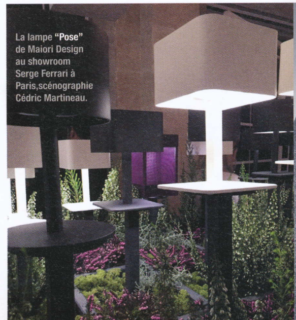
La lampe "Pose" de Maiori Design au showroom Serge Ferrari à Paris, scénographie Cédric Martineau.