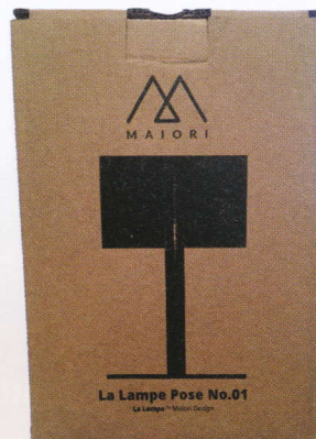
Le packaging de la lampe "Pose". Maiori Design

utilisée dans l'aviation et la navigation, très résistant à la corrosion, ultra léger et entièrement recyclable) et un abat-jour habillé d'un tissu technique développé avec Serge Ferrari. Sans fil, ronde ou carrée, "Pose" restitue et prolonge la lumière même lorsque le soleil a disparu. Les lampes Maiori sont vendues en France à travers un réseau de distributeurs tel que le Cèdre Rouge à Paris et à Lille, chez Fermob à Paris, Lyon et Marseille, via Sifas à Toulon et bien sûr online sur maiori.com